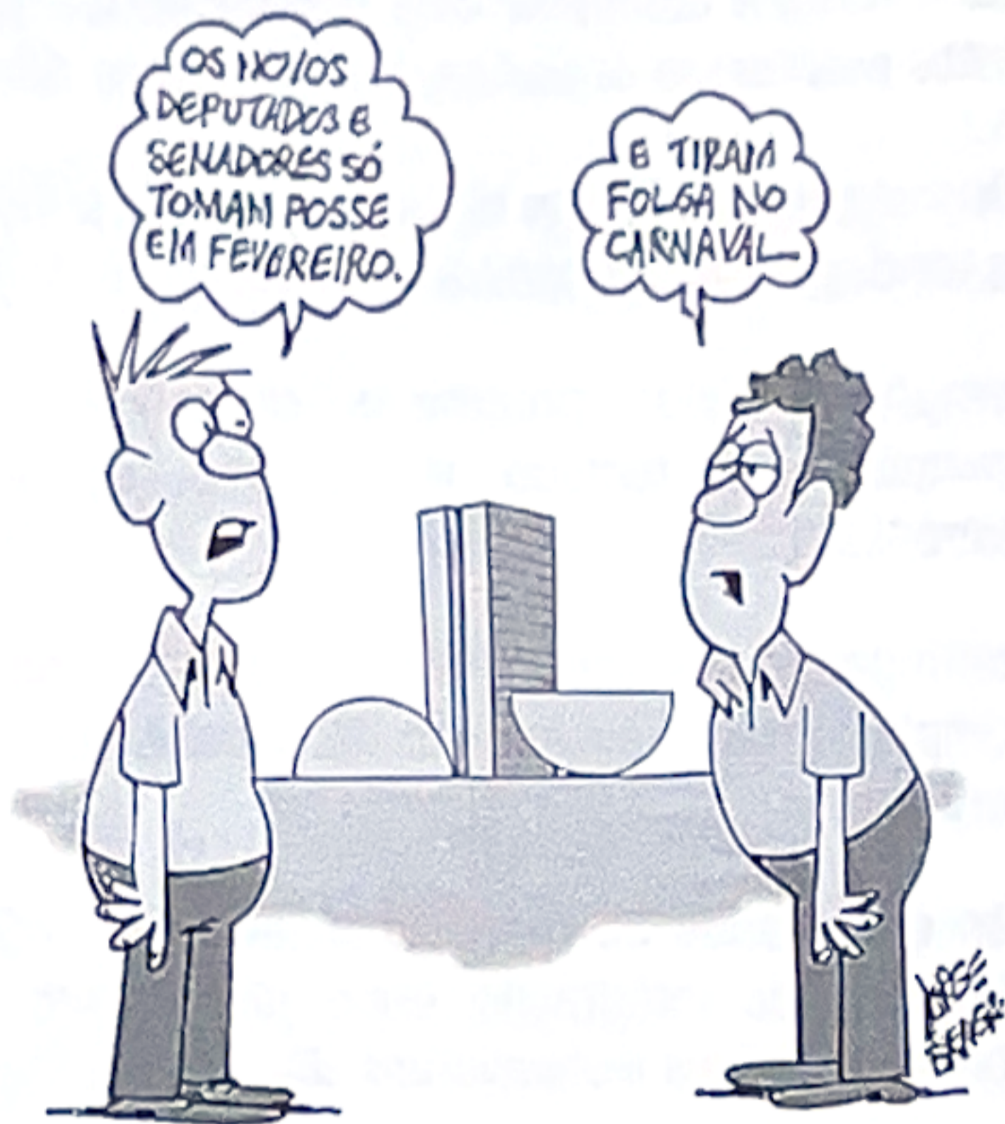
BRAGA, Jorge. [Charge]. O Popular, Goiânia, 10 jan. 2019.

A charge satiriza o desrespeito ao princípio ético-administrativo da