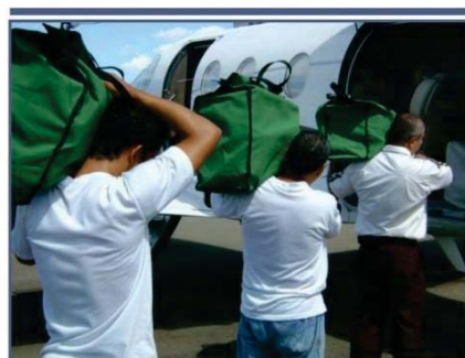
Carregamento de malotes