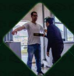
RÍGIDO CONTROLE DE ACESSO