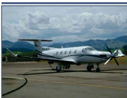
Avião próprio para transporte de malotes