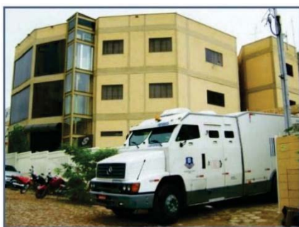
Transporte seguro das provas

Após a aplicação das provas, as Folhas Óticas de Respostas e as Folhas de Texto Definitivas serão lacradas novamente em malotes, e receberão o mesmo tratamento e transporte utilizado na aplicação e distribuição das provas.