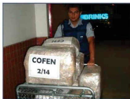
Entrega do malote no local da prova