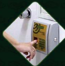
BIOMETRIA PARA ACESSO RESTRITO