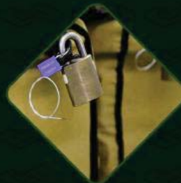
CADEADOS ELETRÔNICOS COM DATAS E HORÁRIOS DE ABERTURA E FECHAMENTO PROGRAMADOS