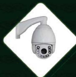
MODERNO SISTEMA DE MONITORAMENTO COM 280 CÂMERAS IP DE ALTA DEFINIÇÃO