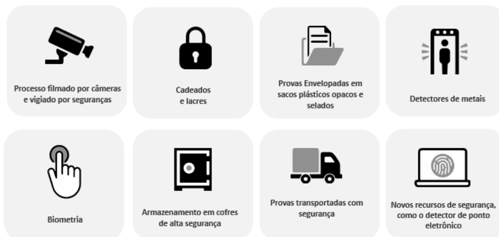
Figura 8 – Sistemas de Segurança

Como, para a FGV , segurança é fundamental, além dos investimentos citados acima, foi contratado o maior especialista em inteligência do Brasil, o ex-diretor-geral da Polícia Federal, Leandro Daiello, para coordenar os trabalhos de inteligência e segurança dos nossos concursos.