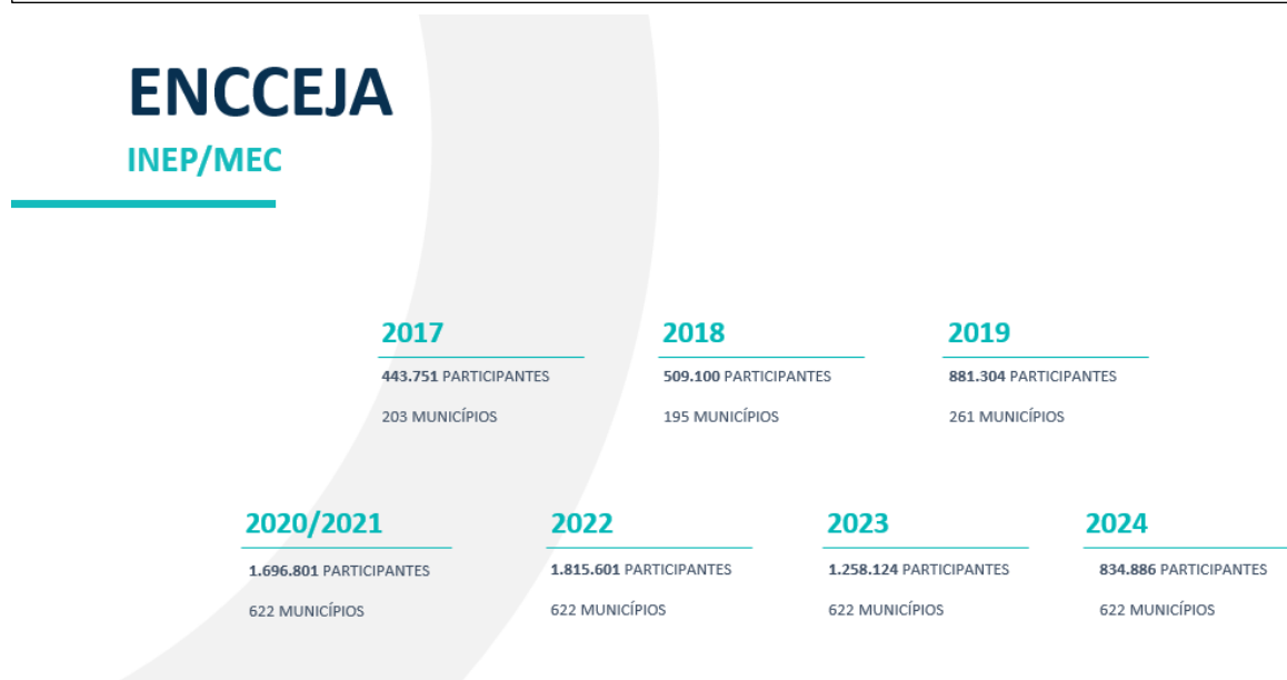
Figura 5 – ENCCEJA

A FGV foi responsável pela aplicação de aproximadamente 30% do ENCCEJA – o Exame Nacional para Certificação de Competências de Jovens e Adultos, durante os anos de 2017 a 2019. Desde 2021, a FGV é 100% responsável pela realização do exame.