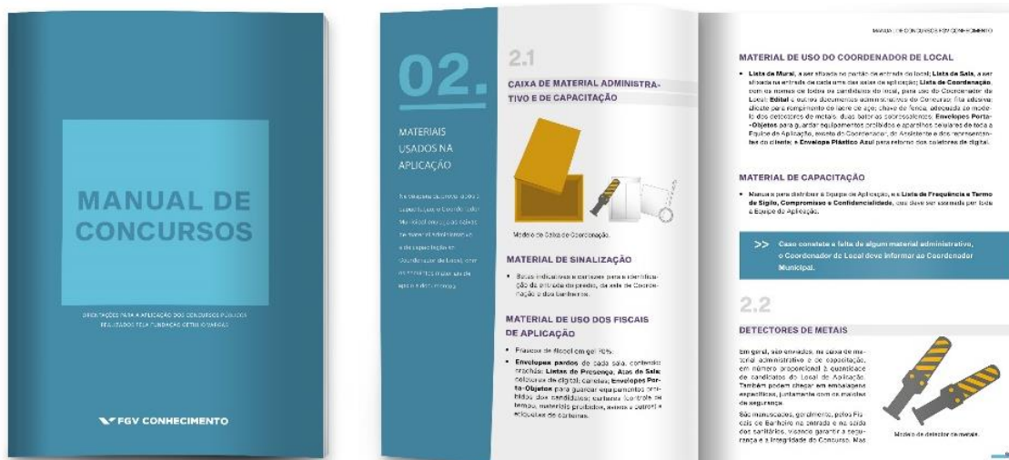
Figura 12 – Manual de Concursos

Vale ressaltar que os nossos processos de capacitações e treinamentos são baseados em manuais desenvolvidos especificamente para cada concurso, exame ou avaliação. Vide Figura 12.