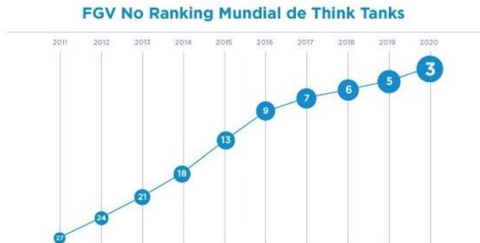
Figura 1 – Ranking Mundial – Think Tanks