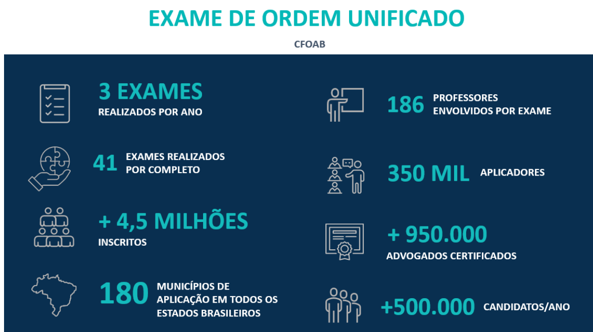
Figura 6 – Exame de Ordem Unificado – CFOAB

A FGV é responsável também pela realização do Exame de Ordem Unificado , o mais importante Exame de classe do Brasil, do Conselho Federal da Ordem dos Advogados do Brasil ( CFOAB ), desde 2011, estando agora na sua 42ª edição. Por esse exame já passaram mais de 4,5 milhões de examinandos em Direito e foram certificados mais de 950 mil advogados. Vide Figura 6.