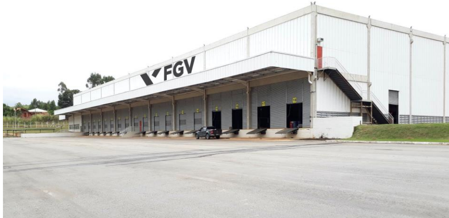
Figura 10 – Ambiente Gráfico e Logística Reversa