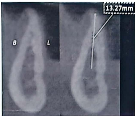
C. Adams, H. Galta-Araujo, A. Franco, M.O.S. Soares, J.L.C. Junqueira, A.C. Oetting. Influence of CBCT-derived panoramic curve variability in the measurements for dental implant planning. Oral Radiology , 2024, Jan, 49(1), p. 30-36 (com adaptações)

A imagem a seguir corresponde a uma tomografia computadorizada de feixe cônico com a finalidade de planejar uma reabilitação dentária implantossuportada na região edentula do primeiro molar inferior direito. A linha vertical demonstra a medida da altura óssea disponível para a colocação do implante, que vai do topo da crista óssea até o osso cortical superior da mandíbula.