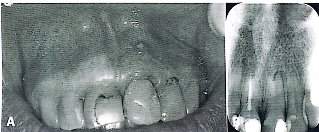
Imagem A: imagem intrabucal da região vestibular superior evidenciando a presença de restaurações nos dentes 11, 12, 21 e 22; dente 21 com imagem de inflamação na região gengival com presença de fistula na região apical. Imagem B: radiografia periapical da região evidenciando dente 12 com restauração na mesial; dente 11 com restaurações extensas e com tratamento endodôntico; dente 21 com restauração distovestibular e aspecto de rarefação óssea periapical; e dente 22 com restauração mesial.

Paciente masculino, com 62 anos de idade, hipertenso, dirigiu-se ao serviço odontológico com queixa de surgimento de uma bolha na região vestibular dos dentes anteriores e superiores. Relatou perceber a saída eventual de líquido de cor amarelada e gosto ruim. Referiu, ainda, fazer uso diariamente de losartana 50 mg e metformina 500 mg. Ao exame físico, foram observadas restaurações nos dentes anteriores e a presença de fistula na região relacionada ao ápice do dente 21, conforme imagens A e B a seguir. No exame radiográfico, foi possível observar: o dente 12 com restauração na mesial; o dente 11 com restaurações extensas e com tratamento endodôntico; o dente 21 com restauração distovestibular e aspecto de rarefação óssea periapical; e o dente 22 com restauração mesial.