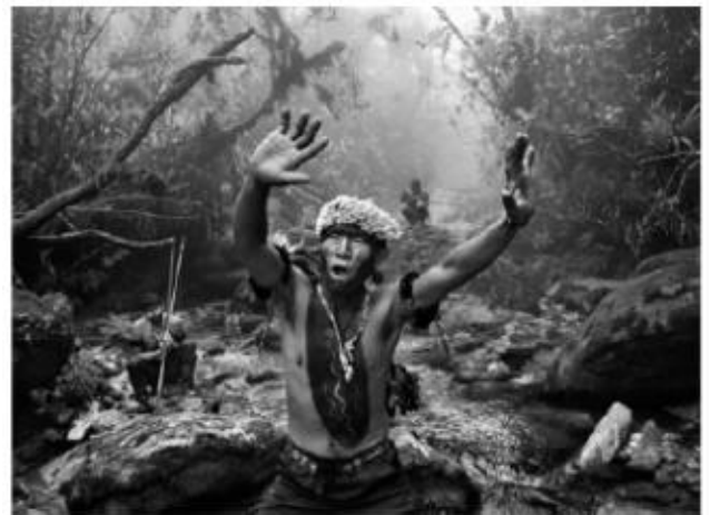
Fotografia de Sebastião Salgado (2017): Xamã Yanomami em ritual durante a subida para o Pico da Neblina, na serra do Imeri (Amazonas).

A exposição “Amazônia” do fotógrafo Sebastião Salgado no Sesc Pompeia (São Paulo, 2022) tem o objetivo de alimentar o debate sobre o futuro da floresta amazônica e das comunidades indígenas brasileiras em uma fase de aumento do desmatamento do bioma amazônico, que foi 56,6% maior entre agosto de 2018 e julho de 2021 do que entre agosto de 2015 e julho de 2018, segundo estudo do IPAM (Instituto de Pesquisa Ambiental da Amazônia).