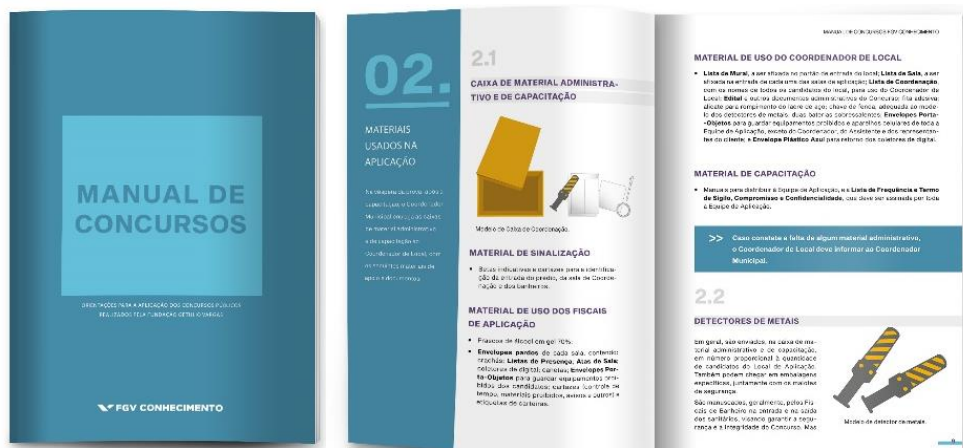
Figura 2.7.2 – Manual de Concursos

Abaixo é apresentado parte do projeto de diagramação desenvolvido pela FGV Conhecimento para o Manual de Concursos , Figura 2.7.2 , bem como a relação de capítulos que compõe o seu índice.