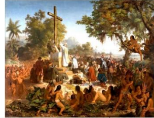
Victor Meirelles. Primeira Missa no Brasil . Óleo sobre tela. 1860. Museu Nacional de Belas Artes.

49. Considere as seguintes representações iconográficas: