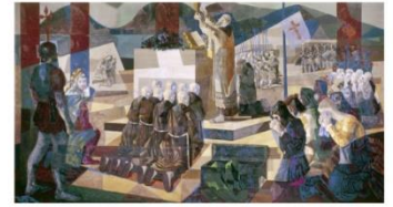
Candido Portinari. A Primeira Missa no Brasil , 1948. Banco Boa Vista.

As duas imagens podem ser utilizadas nas aulas de História para evidenciar que: