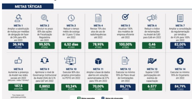
Figura 4 - Resultado das metas táticas em 2022

9.3.18. Quanto ao índice de cumprimento das 12 (doze) iniciativas táticas e ao percentual de esforço de alcance das metas desses planos institucionais, que contribuem para alavancar as metas táticas, o resultado do 4º trimestre/2022 reflete que 58,33% das iniciativas atingiram suas metas no período, sendo que o nível de esforço para alcançá-las chegou a 96,80%, demonstrando o alto empenho das equipes técnicas para cumprir com os seus respectivos planos institucionais.