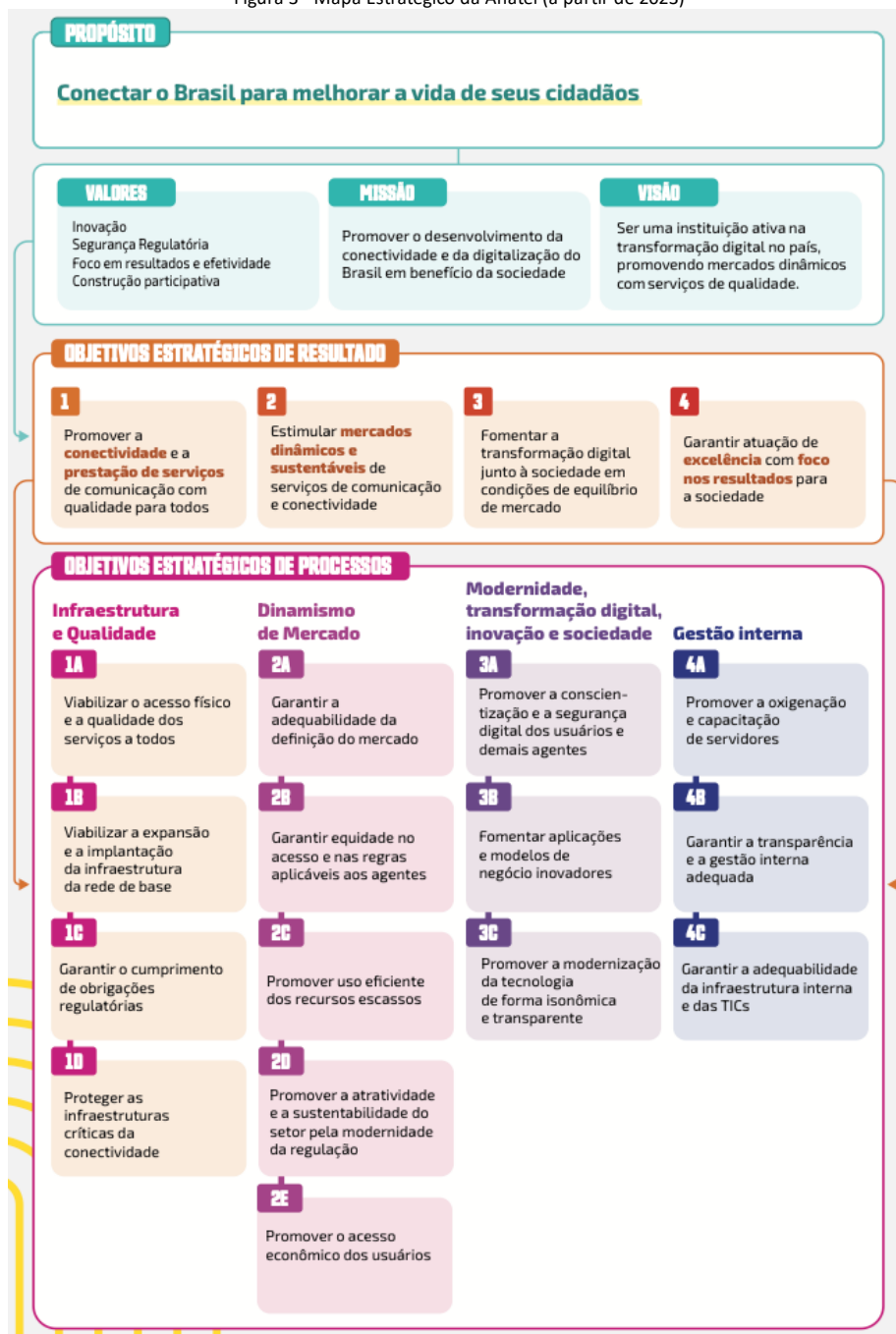
Figura 3 - Mapa Estratégico da Anatel (a partir de 2023)

visualizadas no novo Mapa Estratégico da Agência, atualizado em 2023 são, respectivamente, o propósito, os valores, a missão e a visão que orientam o planejamento estratégico e a gestão cotidiana das atividades das equipes, auxiliando na tomada de decisões: