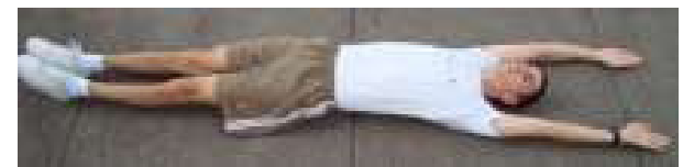
Posição Final (3)

1.3.2 Os índices (IMDP e IMA) do teste de flexão abdominal remador serão atribuídos conforme a tabela a seguir: