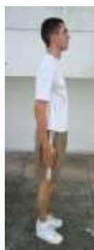
Posição Inicial (1)