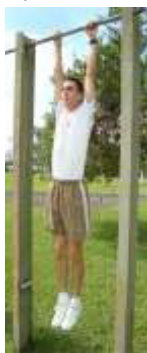
Posição Inicial (1)