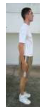
Posição Final (5)

1.5.3 Os índices (IMDP e IMA) do teste de meio-sugado serão atribuídos conforme a tabela a seguir: