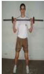
Posição Inicial (1)