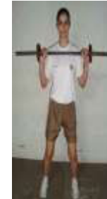
Posição Final (3)

1.2.2 A candidata deverá realizar o maior número de extensão de braços, até o limite da resistência da candidata, sem executar movimentos de flexão de pernas ou qualquer outro movimento que impulse para cima os halteres, além dos braços.