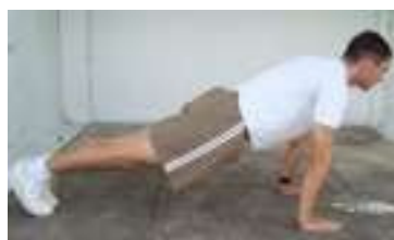
Posição Final (3)