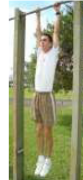
Posição Final (3)

1.1.2 Os cotovelos devem estar em extensão total para o início do movimento de flexão.