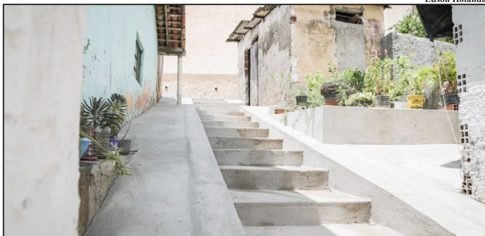
Obra contra deslizamento de terra na Rua do Anil teve investimento de R$ 3,8 milhões

dão tá feito e não tem mais o sentimento de medo”, agradeceu.