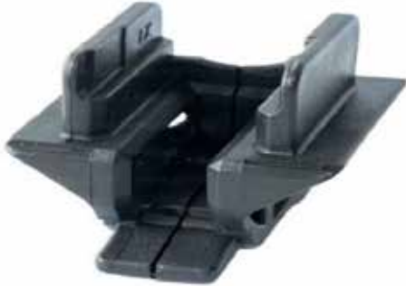
Adaptador para Coldre da Pistola TH40 .40