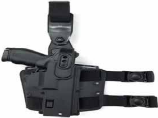
Adaptador para Coldre da Pistola PT100 .40