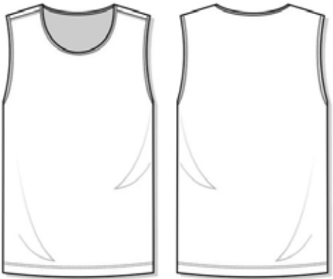
Modelo Camiseta Regata Branca Masculina