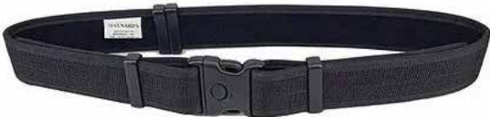
Modelo Cinto Preto