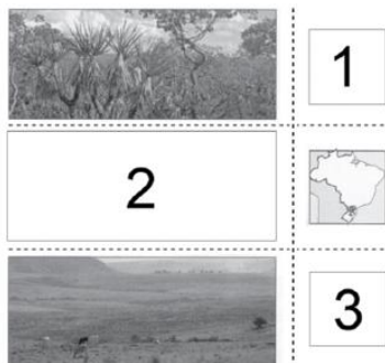
FORMAÇÃO VEGETAL E SUA MANIFESTAÇÃO NO TERRITÓRIO

(Graça M. L. Ferreira. Atlas geográfico, 2013. Adaptado)