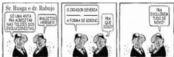
(Folha de S. Paulo, 11.12.2008)

06. Os espaços no segundo quadrinho devem ser preenchidos, correta e respectivamente, com