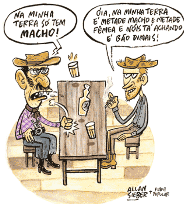
Imagem disponível em: descomplicandoared.blogspot.com . Acesso em 09/05/2012.

10. O Texto 2 pode ser utilizado para ilustrar a seguinte informação do Texto 1: