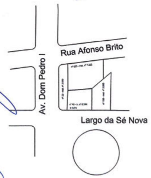
Situação sem escala