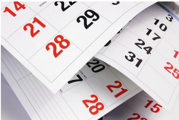
TABELA DE PRAZOS PROCESSUAIS TJSP 2017

Dentro do estudo do Direito Processual Civil, o edital do TJSP abrange os seguintes pontos: